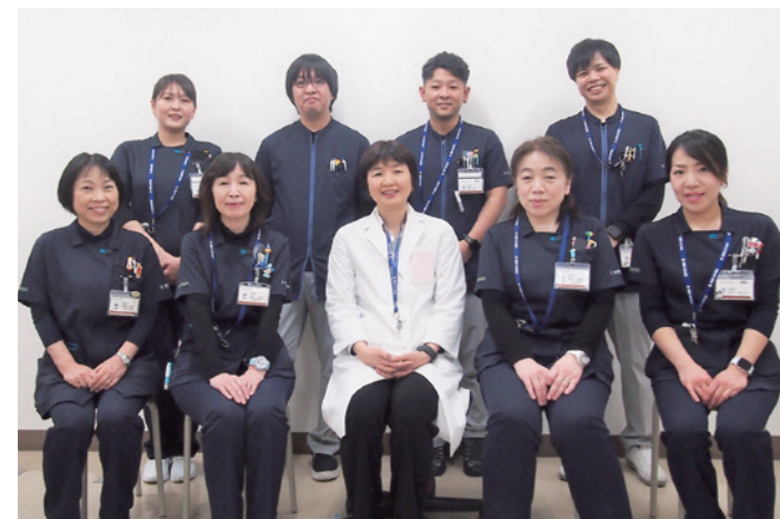
視覚認知外来のスタッフ(医師と視能訓練士)