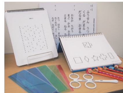
視覚認知について様々な検査を行います

治療が必要かどうか、目の病気の有無を診断した後に、視覚認知の検査を行い、有効と考えられる練習を紹介したり、ご希望に応じて学校や療育施設に見え方の情報をお伝えしたり、患者さん一人一人に合わせて対応しています。本人やご家族、周りの人達が見え方の特性について理解することで、日常生活を送りやすくなることに主眼をおき、その環境整備を働きかけます。